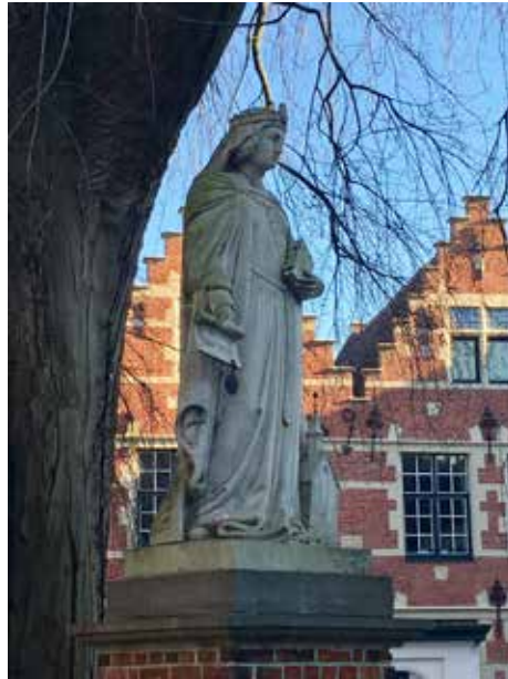
Johanna van Vlaanderen, standbeeld in het begijnhof dat ze in 1238 stichtte te Kortrijk (UNESCO werelderfgoed).

den bungelen. De gravin was echter een felle volhouder, wat haar de denigrerende bijnaam De Zwarte Margriete had bezorgd. Niemand gaf een cent voor haar moederliefde, maar voor de kinderen van haar tweede man zorgde ze goed. Hoe tijdgenoten haar zwartmaakten, blijkt uit de kroniek van de Engelse benedictijnermonnik Matthew Paris (1200-1259), die haar wreed laat zeggen dat het lot van haar vastgezette zonen haar beleid niet zal hinderen: 'Wurg ze, wrede beul, en maak er een maaltijd van, de een gekookt met peper en de ander aan het spit,