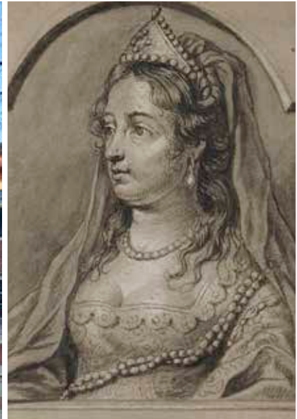
17de-eeuwse afbeelding van Margaretha van Vlaanderen, door Jan Meyssens.

aanwees als arbiter. Hij liet alle verbeurdverklaringen van Willem II vervallen maar splitste wel uit machtspolitieke overwegingen haar gebied op: Jan van Avesnes kreeg Henegouwen, Gwijde van Dampierre erfde Vlaanderen. Margaretha beet zich echter vast in de macht. In Henegouwen bleef ze op de troon tot haar dood, maar in Vlaanderen liep het anders: in 1278 vond zoon Gwijde, 52, het genoeg. Margaretha was 76 jaar, vrouwen werden destijds gemiddeld half zo oud. Ze had 34 jaar geregeerd, maar nu zette Gwijde haar af, tegen haar zin. De kroon