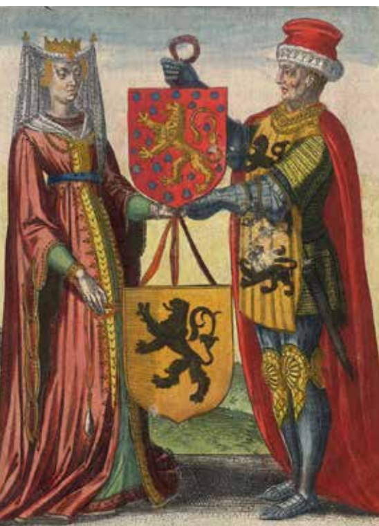
Margaretha van Constantinopel en Willem II van Dampierre (afbeelding uit Flandria illustrata, 1641).

In de hoop nog een zoon te baren, hertrouwde Johanna met de edelman Thomas van Savoie, een man die van feesten aan buitenlandse hoven hield en nauwelijks mee regeerde. Maar er kwam geen zoon. Johanna stierf in 1244. Haar zuster erfde de troon van Vlaanderen en Henegouwen. Weer moesten de onderdanen zich morrend aan een vrouw onderwerpen. De 42-jarige Margaretha was inmiddels weduwe geworden. Ze schonk de oudste zoon uit haar tweede huwelijk, Willem van Dampierre, min of meer voor de sier de titel graaf van Vlaanderen (dit stond beter tijdens zijn kruistocht), maar ze wilde tot haar dood